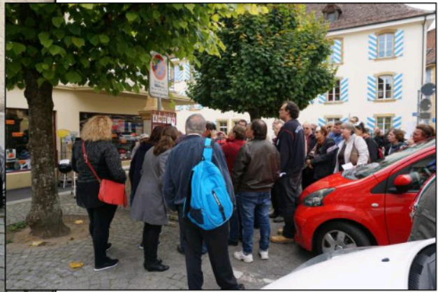
Photo : Visite du parcours didactique à Colombier