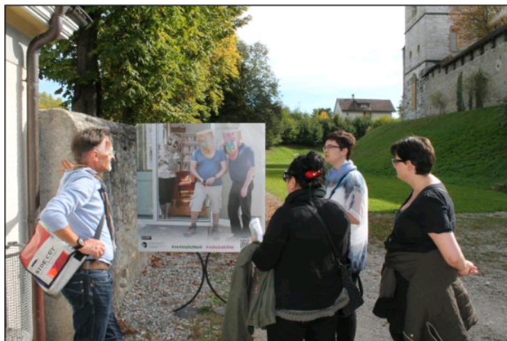
Photo : visite de l'éc à Morat le 10 octobre

templer la belle vitrine de Morat tourisme, dans laquelle étaient exposés tous les masques originaux réalisés par les membres. Après toutes ces découvertes, nous avons fait une pause-café au soleil (ou presque), et nous avons tous bien profité de ce